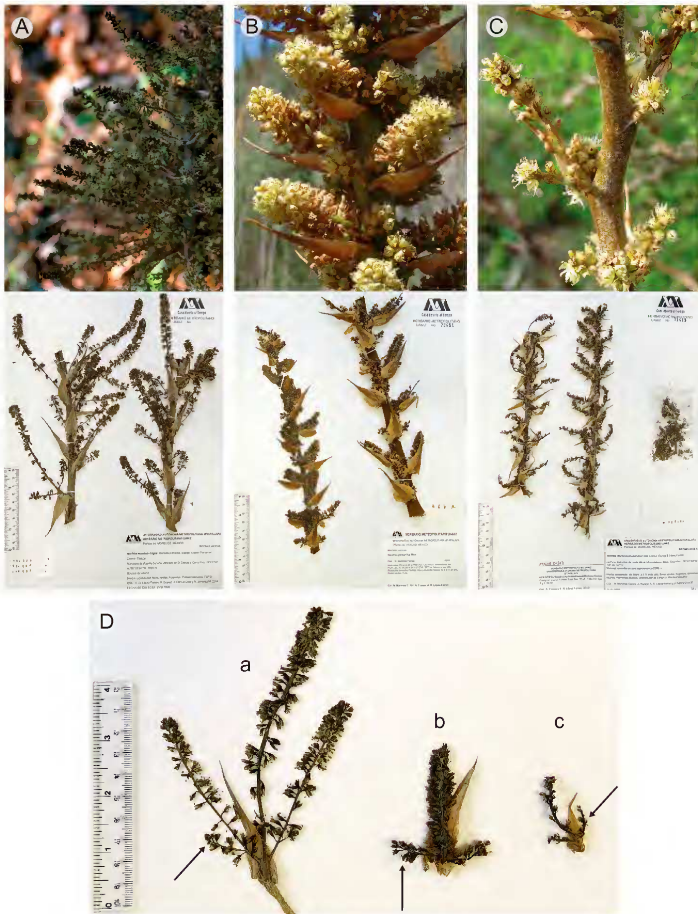
Fig. 3. Inflorescencias masculinas. A. H. montis-frigidi González-Rocha, Espejo, López-Ferr. et Cerros-Tlatilpa (A. R. López-Ferrari 2206). B. H. podantha Mez (N. Martínez C. 101). C. H. chichinautzensis Martínez-Correa, Espejo et López-Ferr. (N. Martínez C. 37). D. Ramas primarias: a) 3 veces ramificadas de H. montis-frigidi ; 2 veces ramificadas de b) H. podantha ; c) H. chichinautzensis .